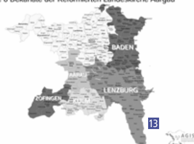
Die 6 Dekanate der Reformierten Landeskirche Aargau