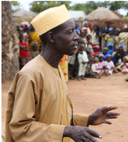
Gemeindeversammlung mit einem Gemeindeberater.

Dabei kommen folgende Grundsätze zur Anwendung: