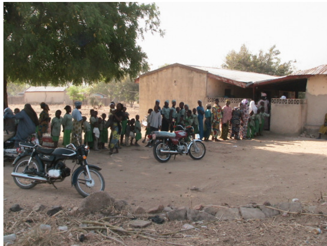
Anstehen für eine Impfkampagne bei der Klink Fadama Rake (Nordostnigeria)

Durch das integrierte ländliche Entwicklungsprogramm (ICBDP) unserer Partnerkirche, der Kirche der Geschwister in Nigeria (EYN), erhält die ländliche Bevölkerung Nordnigerias Hilfe zur Selbsthilfe, um ihre Lebenssituation zu verbessern und neue Perspektiven zu entwickeln für die Zukunft ihrer Dorfgemeinschaft.