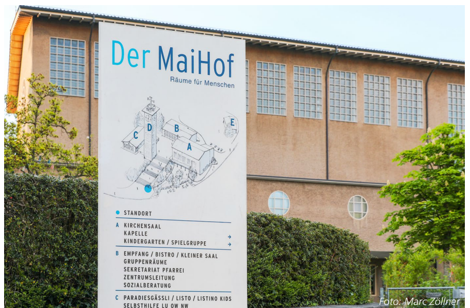
Im «MaiHof» Luzern wird die Kirche dem Quartier zur Verfügung gestellt. So werden die Räume besser ausgelastet.

Viele Kirchgemeinden besitzen mehr Gebäude beziehungsweise Gebäudeflächen als sie aktuell benötigen. Eine Fachtagung zeigte: Wer frühzeitig eine Immobilienstrategie entwickelt, schützt nicht nur seine Liegenschaften, sondern stärkt die Kirche als Ort der Gemeinschaft.