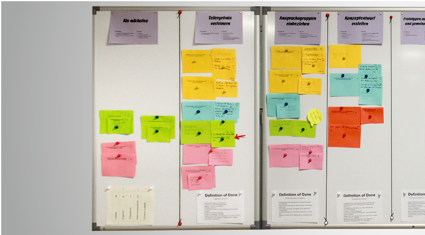
Das Board zur Kirchenreform hilft dem Prozessleitungsteam den Überblick über die Reformvorhaben zu behalten.